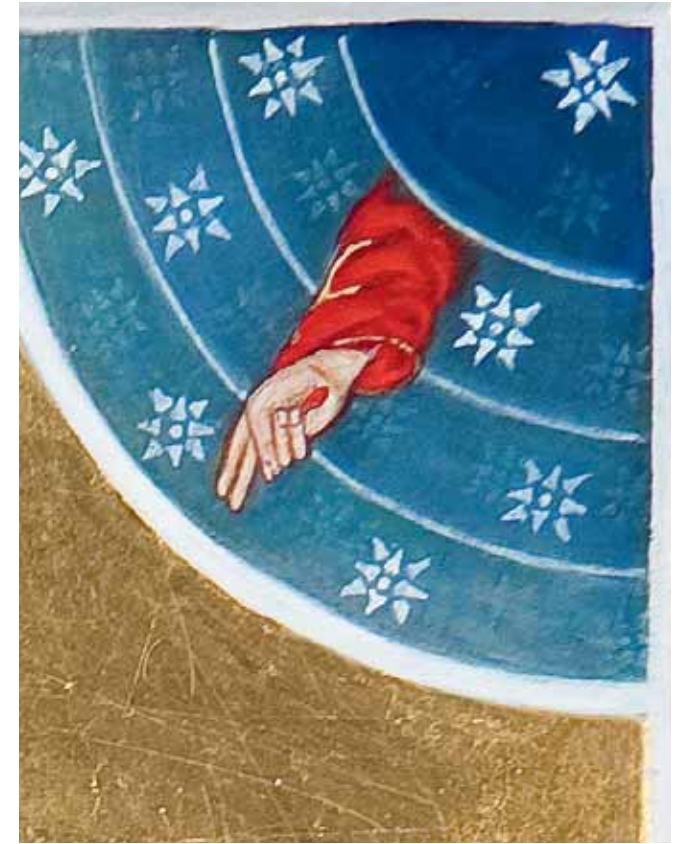
Gesù stende la mano a Stefano

S tefano, fissando gli occhi al Cielo, vede Gesù seduto alla destra di Dio; e mentre le pietre lo colpiscono, così prega: “Signore, in te hanno sperato i nostri padri, e tu li hai liberati. Ora i miei compagni e confidenti mi scherniscono e vogliono eliminarmi. Ma tu, Gesù, non stare lontano da me, perché l’angoscia mi è vicina e nessuno mi aiuta. Signore Gesù, accogli il mio spirito e fammi riposare in te, come un bimbo svezzato in braccio a sua madre; e perdona, Gesù, coloro che mi lanciano le pietre: sono i miei amici d’un tempo, a loro mi legava una dolce amicizia, quando camminavamo in festa verso la tua casa. Sì, Signore, perdonali, perché non ti conoscono ancora”. Detto questo, morì. (Atti 7, 59-60).