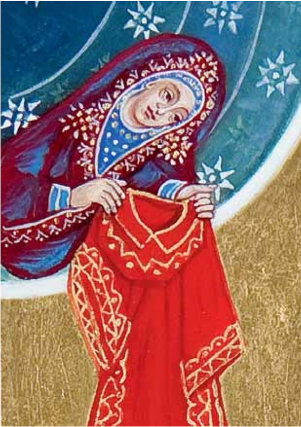
Maria Regina dei martiri