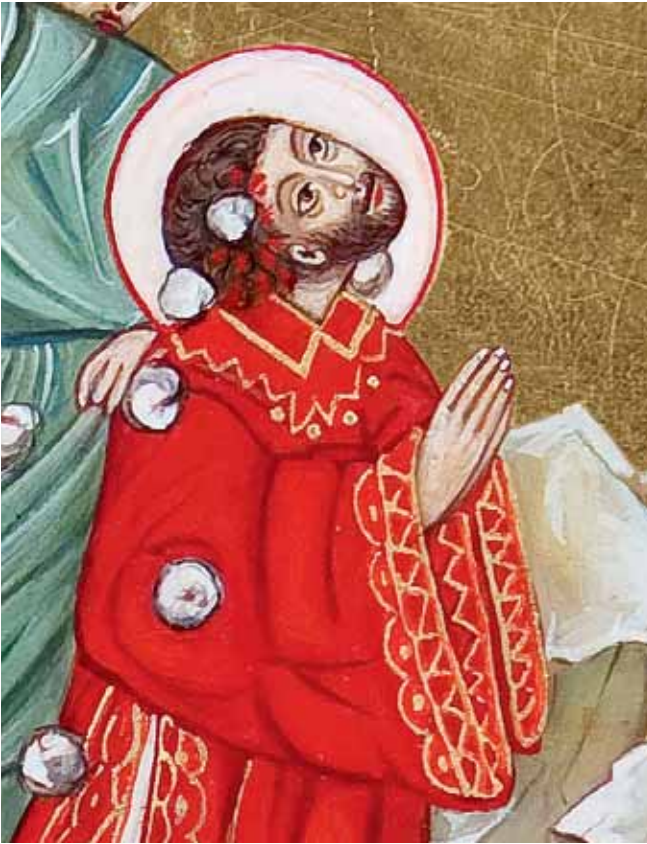
Particolare di Stefano

S tefano, fissando gli occhi al Cielo, vede Gesù seduto alla destra di Dio; e mentre le pietre lo colpiscono, così prega: “Signore, in te hanno sperato i nostri padri, e tu li hai liberati. Ora i miei compagni e confidenti mi scherniscono e vogliono eliminarmi. Ma tu, Gesù, non stare lontano da me, perché l’angoscia mi è vicina e nessuno mi aiuta. Signore Gesù, accogli il mio spirito e fammi riposare in te, come un bimbo svezzato in braccio a sua madre; e perdona, Gesù, coloro che mi lanciano le pietre: sono i miei amici d’un tempo, a loro mi legava una dolce amicizia, quando camminavamo in festa verso la tua casa. Sì, Signore, perdonali, perché non ti conoscono ancora”. Detto questo, morì. (Atti 7, 59-60).